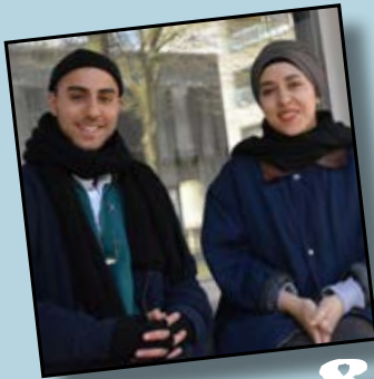
Kunst for og af unge